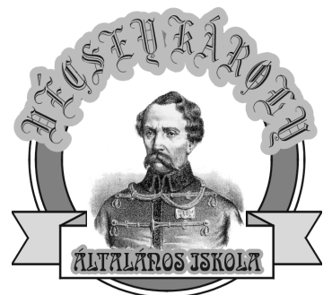
Vécsey Károly Tagintézmény