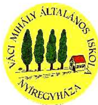
Váci Mihály Tagintézmény