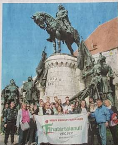
Kolozsváron megkoszorúzták Mátyás király szobrát.